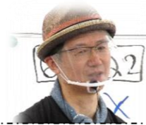
フェイスシールドをしての講座