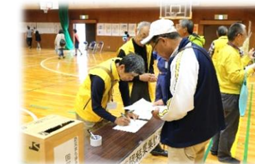
避難防災訓練での安否確認