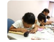
子どもと文化の森