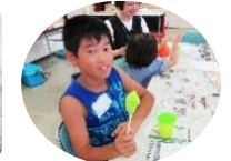
昭和の遊びパーク実行委員会