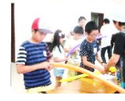
大町さくらメイト