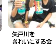
矢戸川をきれいにする会