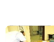
大町少年少女発明クラブ