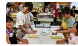
ばんや “なかよしこよし”