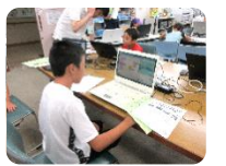
ウィル大町スポーツクラブ