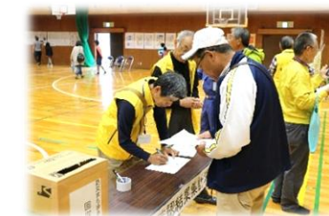
避難防災訓練での安否確認