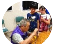
大町町中地域自治組織