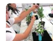
集まれ!まちの芸術家たちの会