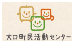
大町町民活動センター

丹羽郡大町町伝右一丁目35番地 健康文化センター2階 TEL/FAX: 22-6642 ホームページ http://machinetoguchi.com (4月より変更になりました) E-mail: machinet@heart.ocn.ne.jp