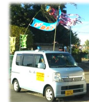
青色パトロール隊は 年間460回活動！

5行政区域(概ね北小学区)で構成されており、年4回区長さんと意見交換を行ったり、北小学校と一緒に事業を行うなど、地域の協力を得て、連携して活動しています