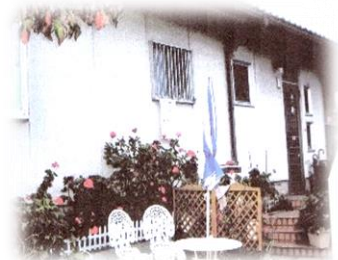
助成金を活用 まちづくり道具箱